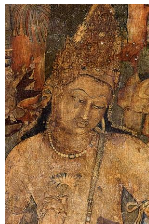
アジャンタ石窟第1窟(守門神壁画)

エローラ石窟群は世界最大の彫刻建築と称されています。古代三大宗教「仏教・ヒンドゥー教・ジャイナ教」の石窟寺院が一同に会する世界で唯一の場所で、6～10世紀にかけて開窟されました。