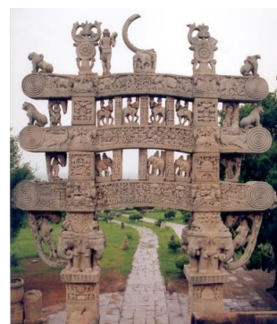
トラーナ(塔門)の飾り彫刻

美しい田園風景に囲まれた小高い丘に3つのストゥーパがあります。大塔(第1ストゥーパ)はアショカ王が建立したレンガ積みで、四方の塔門(トラーナ)は、全面が精細な彫刻で飾られています。ストゥーパは日本では卒塔婆と翻訳された、仏舎利塔のこと。