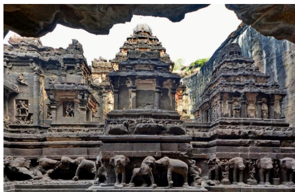
カイラーサナータ寺院(エローラ石窟)