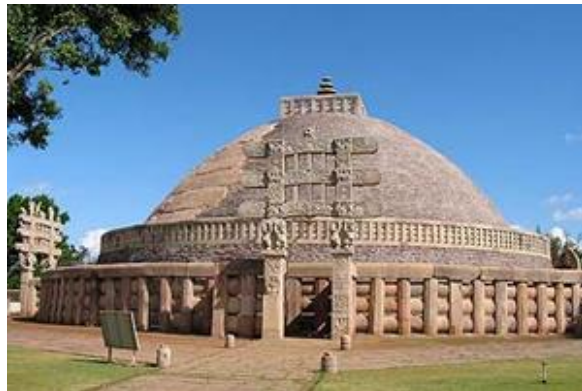
仏教建造物群(サーンチー)

旅行代金 302,000 円（成田空港発着・11名様以上ご参加の場合） 286,000 円（成田空港発着・16名様以上ご参加の場合） 276,000 円（成田空港発着・21名様以上ご参加の場合）