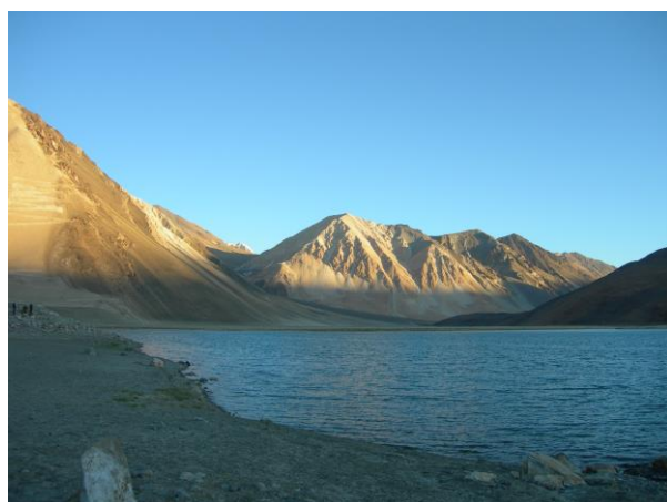
標高4,250mにある塩湖パンゴン・ツォ(湖)

旅行代金 359,000 円（成田空港発着・11名様以上ご参加の場合） 343,000 円（成田空港発着・16名様以上ご参加の場合）