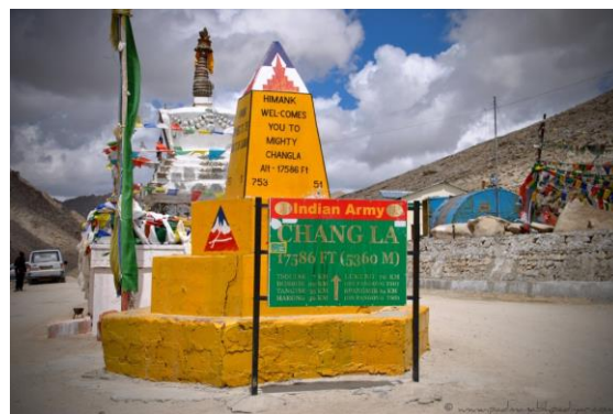
パンゴン・ツォ(湖)へ向かう道のり (チャン・ラ(峠))

本旅行は龍村ヨガ研究所 龍村修の旅行企画を基に、株式会社いい旅が旅行企画実施し株式会社スカイエフワールドが受託販売を担当するものです