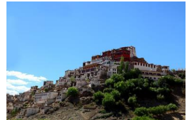
ティクセ・ゴンパ(レー)

かつてのラダック王国の首都レーは、インドのジャンムー・カシミール州に属しますが、地形的にも文化的にもチベット世界の一部です。現在の中国領、チベットでは失われつつあるチベット仏教文化を感じられる町で、多数のチベット仏教僧院(ゴンパ)は見どころ満載です。