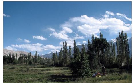
ヌブラ渓谷(イメージ)

ヌブラ渓谷は標高約5600mのカルドゥン・ラ(峠)を超えた先に広がる「世界の果て」ともいわれる場所です。道中の見渡す限り広がる茶褐色の大地を走り抜けると、豊かな自然をたたえるヌブラ渓谷に到着します。「緑の園」を意味するヌブラは、さながら砂漠の中のオアシスです。