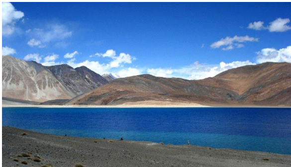
パンゴン・ツォ(湖)